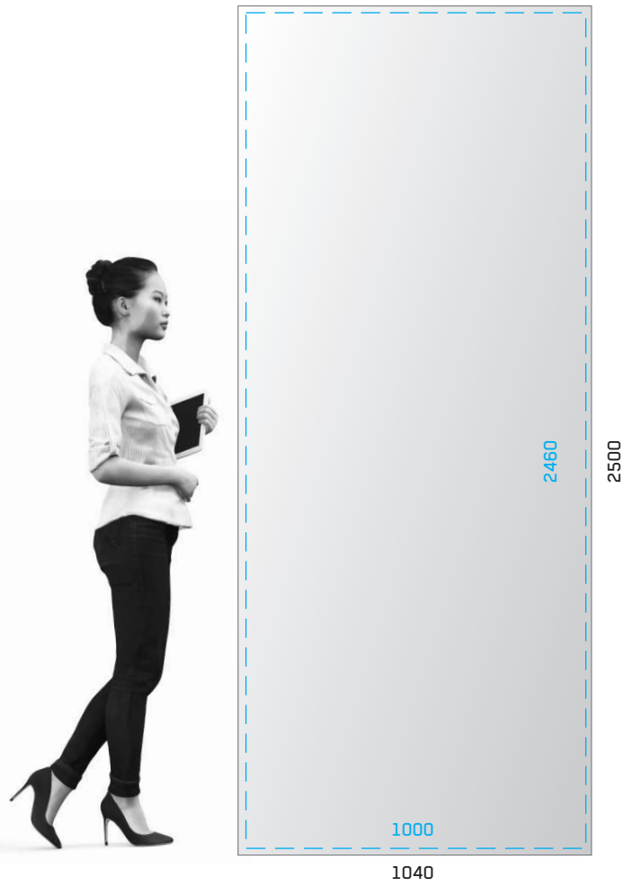
BEISPIEL: MOTIV ÜBERGREIFEND ÜBER 2 ODER MEHR MODULE EXAMPLE: OVERLAPPING MOTIFS COVERING 2 OR MORE MODULES